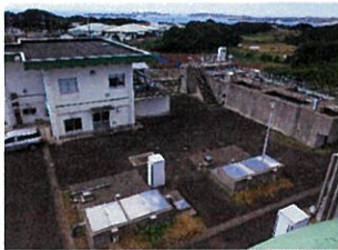
2.門野田浄水場外観

上記主要施設6浄水場を含む150程度の場外施設 (水源、中継ポンプ所、配水池等)